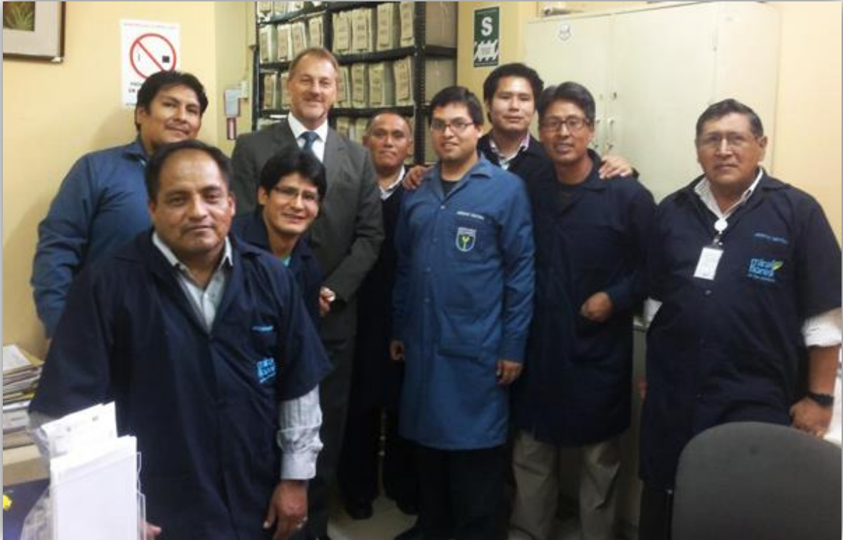
Miraflores 10 de mayo, visita y felicitación del Alcalde al Archivo Central por el día del archivero.