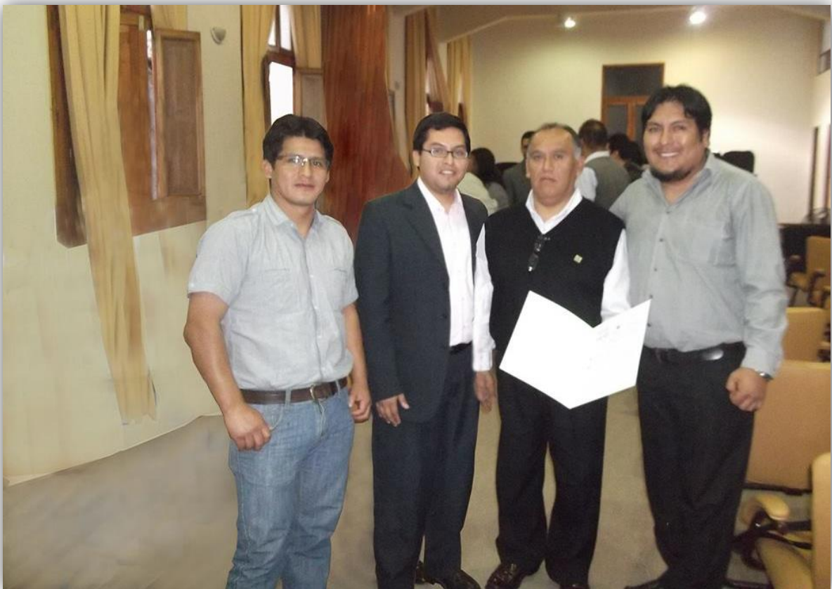
Miraflores 10 de mayo, reconocimiento del Archivo General de la Nación a la Municipalidad de Miraflores por el cumplimiento de sus trabajadores con el Sistema Nacional de Archivos.