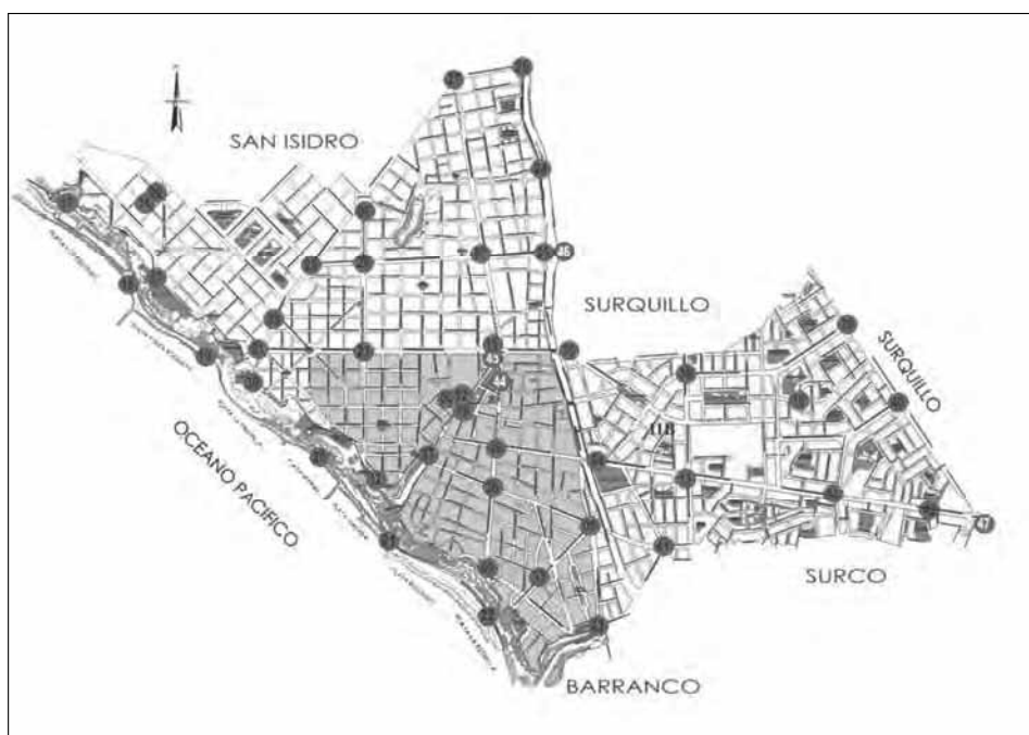
CUADRO N° 32 MAPA DE UBICACIÓN DE CÁMARAS DE VIDEOVIGILANCIA

Asimismo esto ha generado la necesidad de contar con mayor cantidad de personal de supervisión y administrativo, además del aumento otorgado al personal CAS, en función a su nivel de especialización.