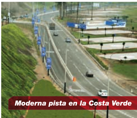
Moderna pista en la Costa Verde