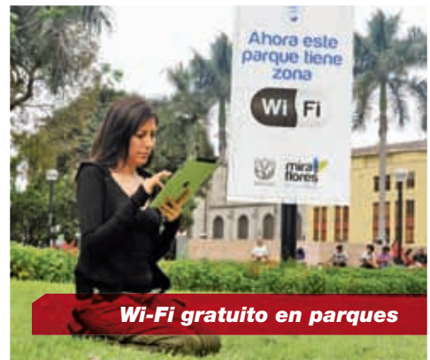
Wi-Fi gratuito en parques