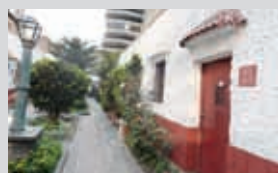
Lugares emblemáticos en la vida de Vargas Llosa están en la ruta turística.