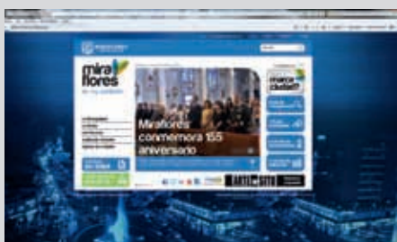
Información accesible a través de la nueva web.

A través de diferentes dispositivos móviles, los ciudadanos pueden acceder al servicio gratuito de Internet, vía Wi-Fi, en los parques: Central (Kennedy y 7 de Junio), Reducto N° 2, María Reiche y Raúl Porras Barrenechea.