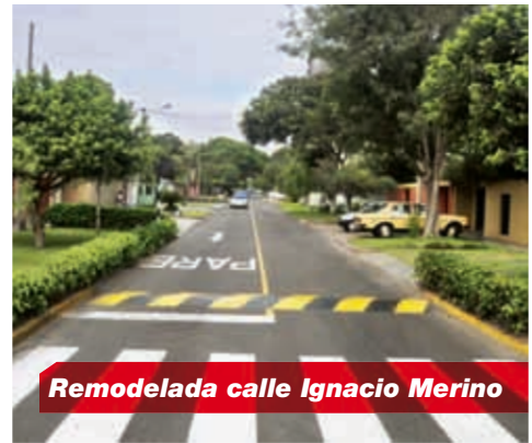
Remodelada calle Ignacio Merino

RENDICIÓN DE CUENTAS 2011 RENDICIÓN DE CUENTAS 2011 RENDICIÓN DE CUENTAS 2011 RENDICIÓN DE CUENTAS 2011 RENDICIÓN DE CUENTAS 2011 RENDICIÓN DE CUENTAS 2011