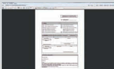
Obtención de licencias vía internet.