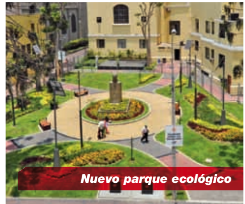
Nuevo parque ecológico