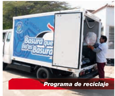
Programa de reciclaje