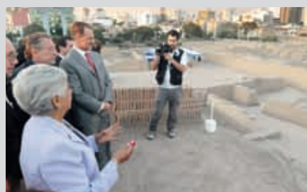
Constantes excavaciones y descubrimientos en la Huaca Pucllana.