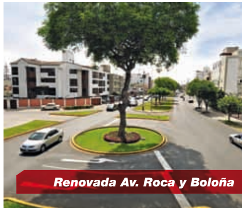
Renovada Av. Roca y Boloña