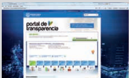
Permanente actualización de Información pública.