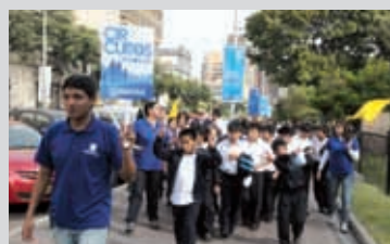
Se incentiva el turismo entre los estudiantes.