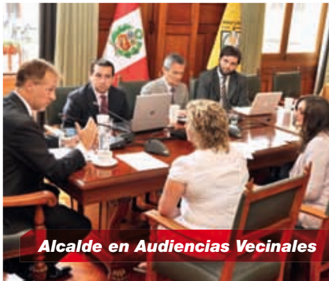
Alcalde en Audiencias Vecinales