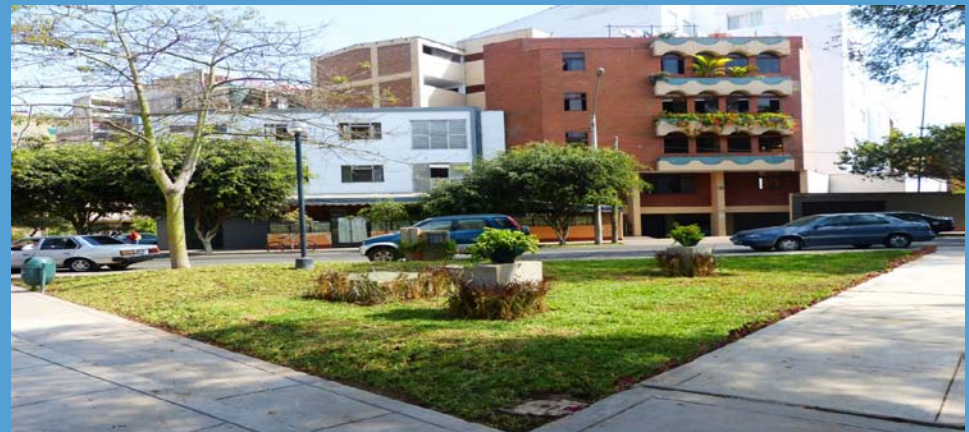
Área verde recuperada en el área de la cisterna al finalizar la obra.

Construcción y equipamiento de una cisterna de 70 m 3 , en el parque Fermín Tangüis, desde la cual y, de dos grupos de electrobombas, se impulsa el agua hacia la red matriz de aspersores instalados en la berma central de la Av. Arequipa (cuadras 38-52), siendo el área a regar de 13,172.15 m 2 .