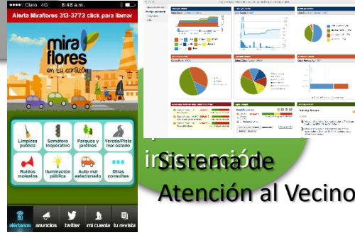
Sistema de Atención al Vecino