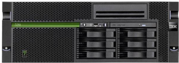
AS/400 – Power6