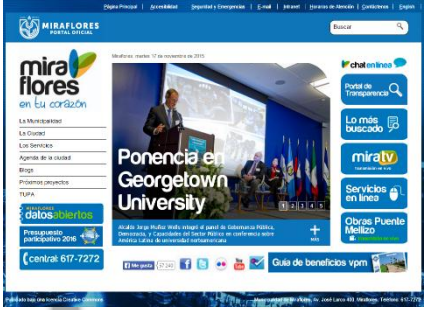
Plataforma de Atención