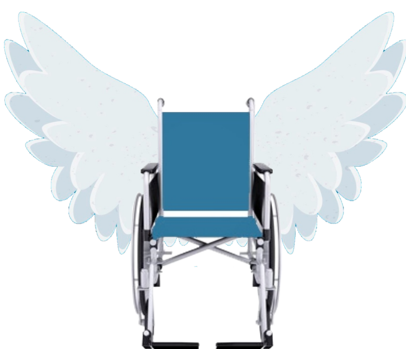
IMÁGENES DE INTERNET. COMPOSICION