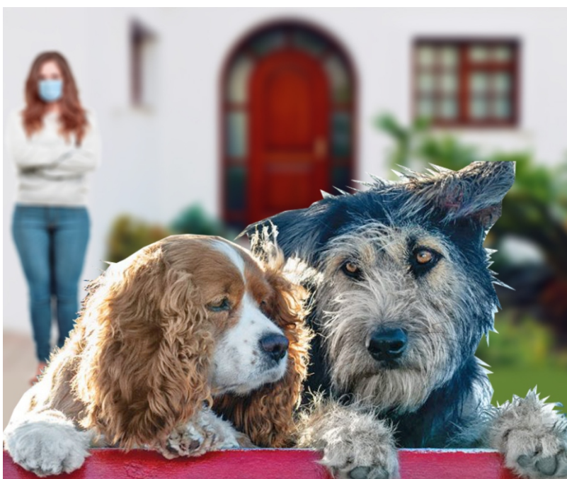
COMPOSICIÓN CON TRES IMÁGENES DE INTERNET