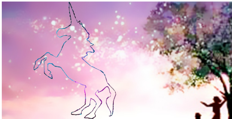
IMÁGENES DE INTERNET. COMPOSICIÓN.