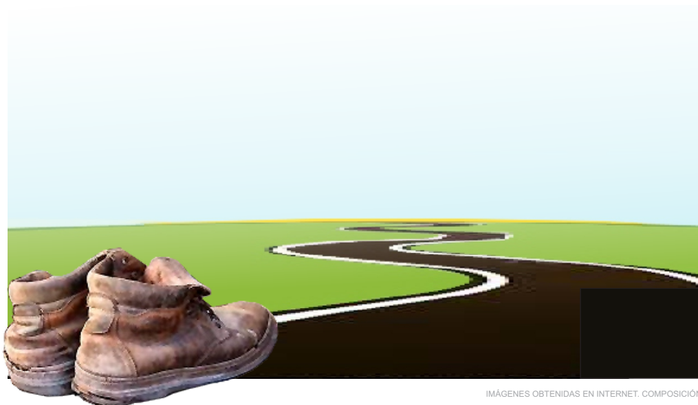
IMÁGENES OBTENIDAS EN INTERNET. COMPOSICIÓN.