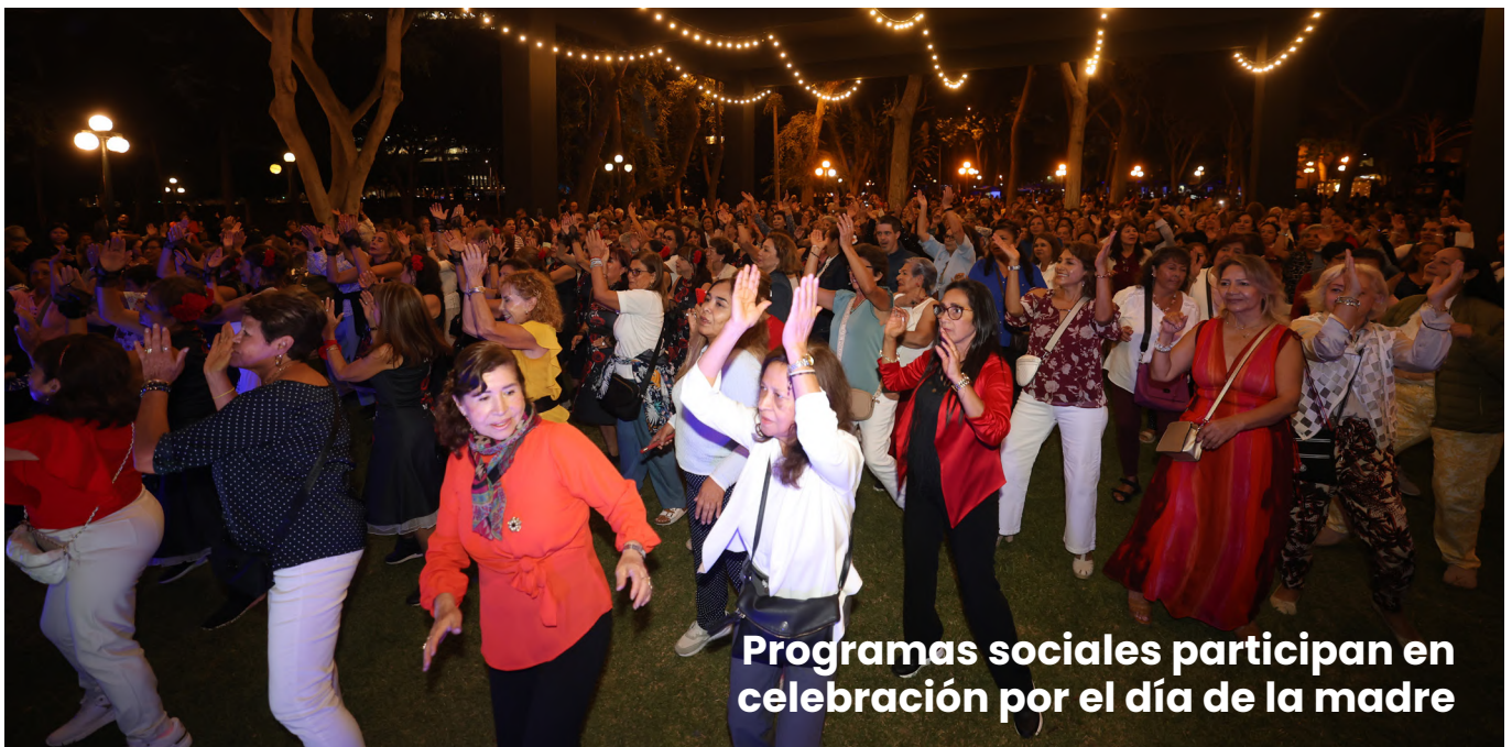
Programas sociales participan en celebración por el día de la madre