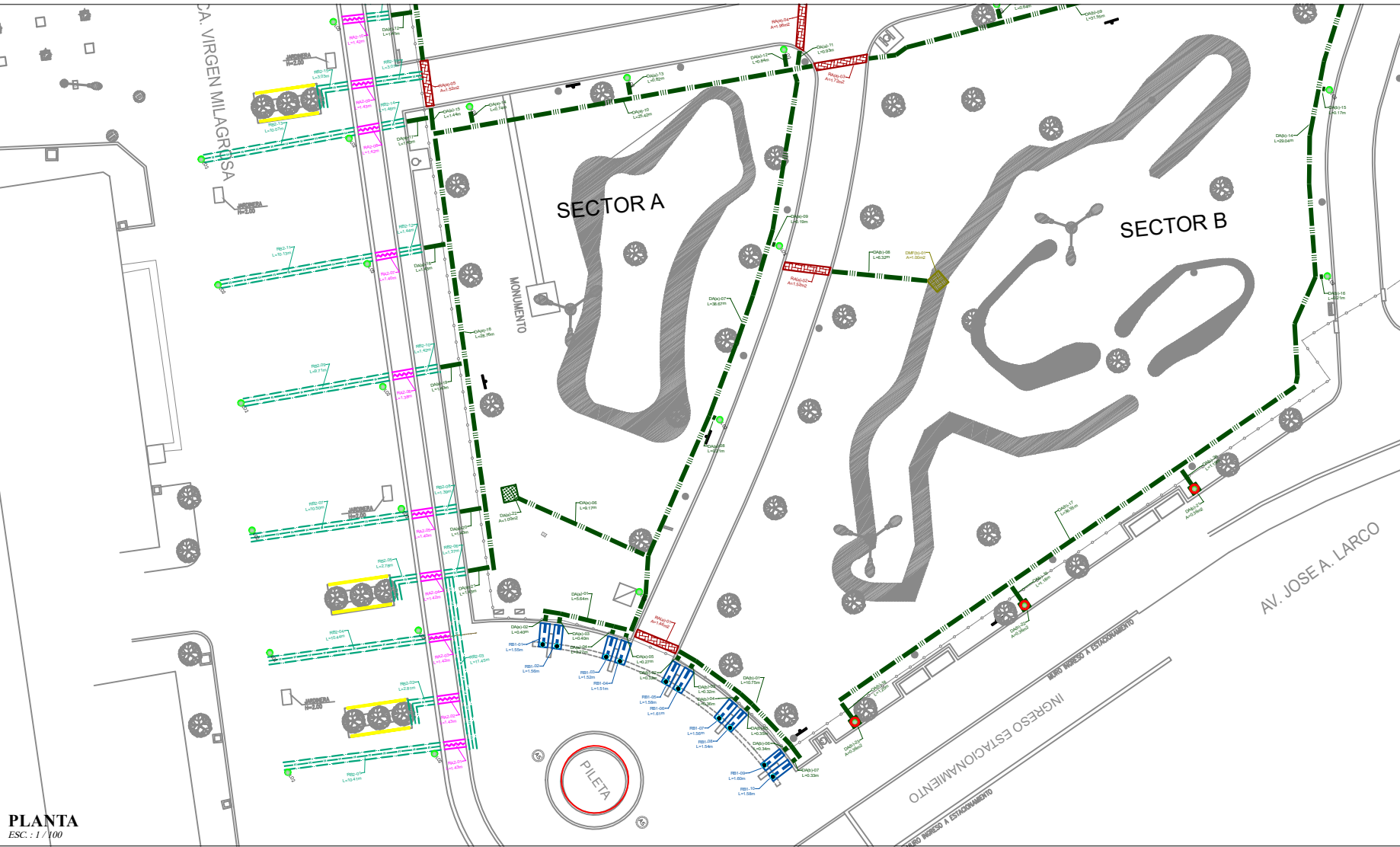
PLANTA ESC.: 1 / 100